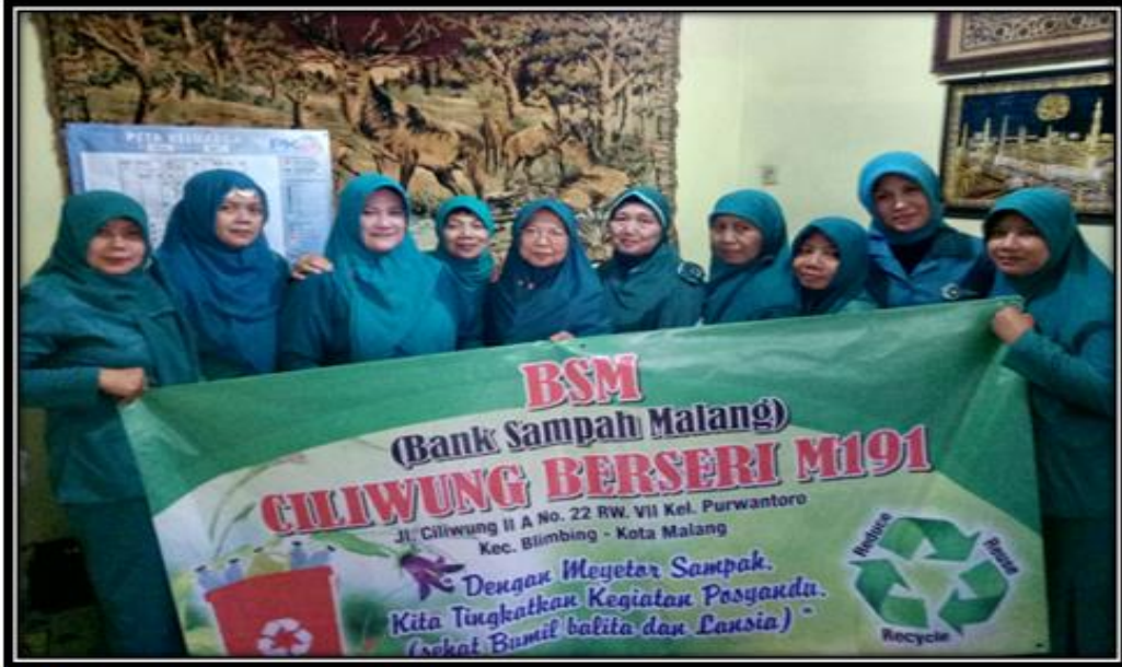
BAYAR SAMPAH KERING BANTUAN PMT LOKAL POSYANDU