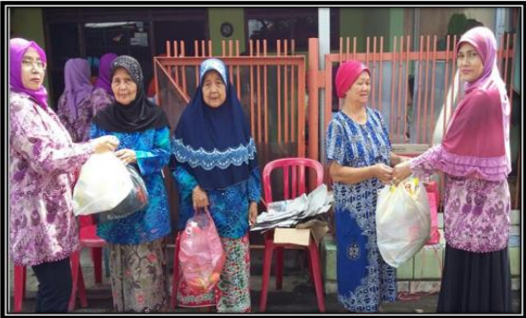
PARA LANSIA SETOR SAMPAH KERING KE POSYANDU LANSIA