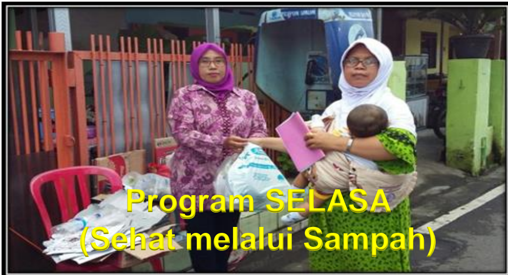
Program SELASA (Sehat melalui Sampah)