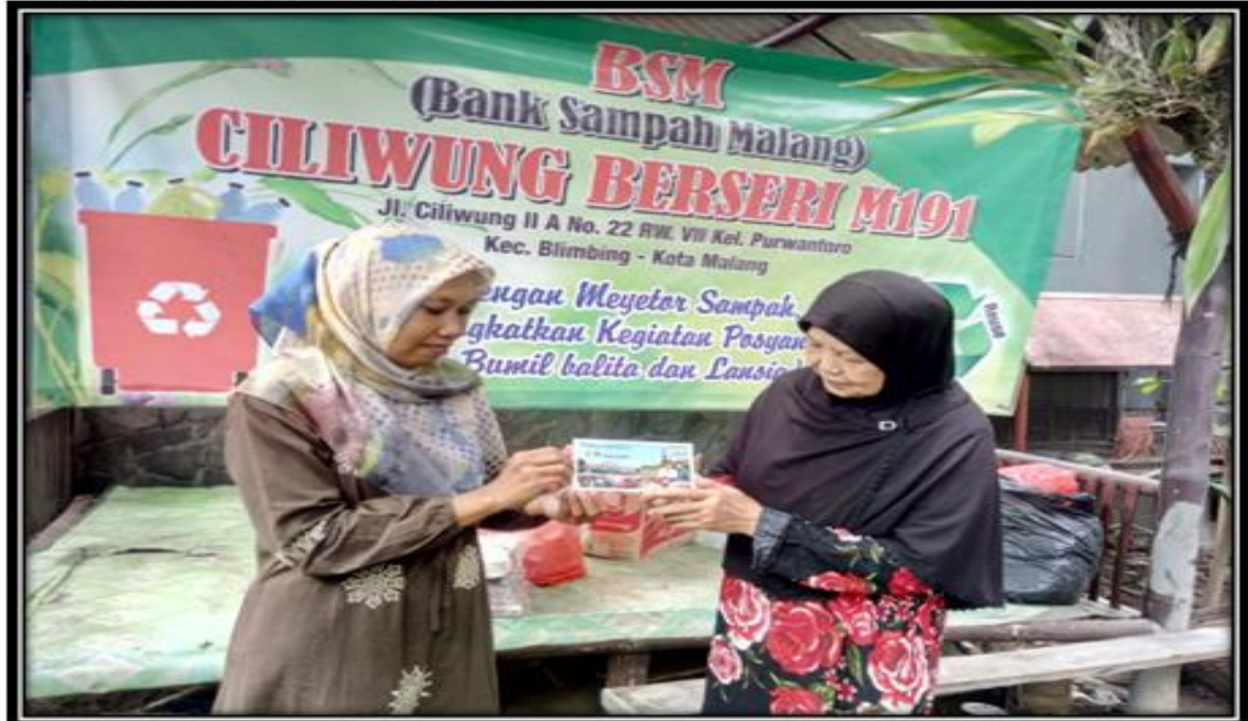
DAPAT BUKU ANGGOTA BSM