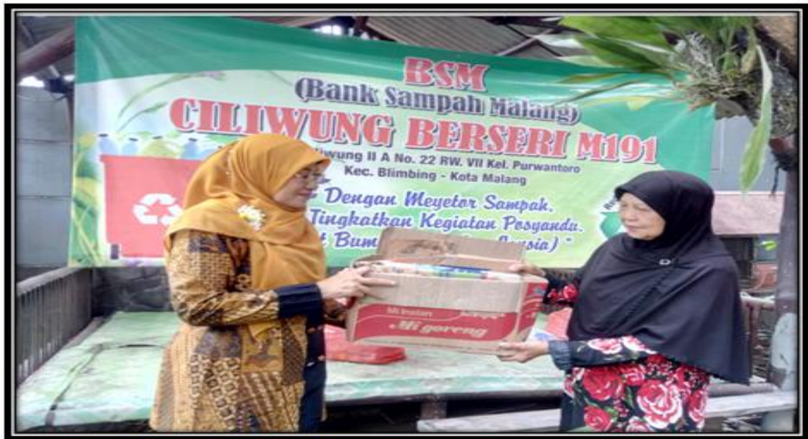
SETOR SAMPAH KERING KE BSM RW.07 OLEH KADER POSYANDU