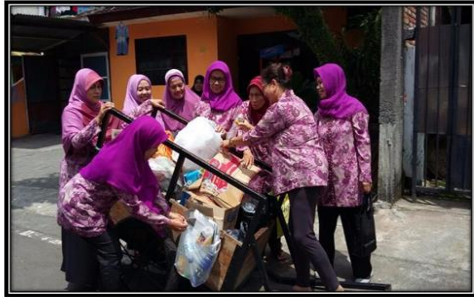
KADER POSYANDU SETOR SAMPAH KE BSM TERDEKAT